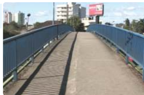
Passarela do Bairro Primavera - BR 116 Novo Hamburgo

O deputado Eliseu Padilha, ministro dos Transportes no período de 1997 a 2001, investiu R$ 230 milhões para a melhoria e expansão da Trensurb. Além de restaurar e pavimentar pistas e ruas laterais na BR-116, Padilha criou o Programa Via Expressa, com 21 obras de grande importância para o Vale dos Sinos, como o trevo de acesso a Dois Irmãos e a construção de passarelas e viadutos. Padilha construiu a av. Unisinos, ampliou a av. Mauá e construiu moradias no Loteamento Tancredo Neves.